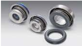
自動車ウォーターポンプ用コンパクトシール