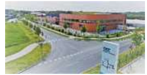
Eagle ABC Technology S.A.S.

2015 ▶ フランスのABC Technology社を子会社化(現Eagle ABC Technology S.A.S.)