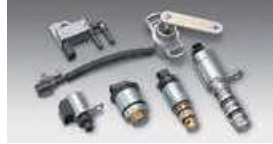
自動車用各種ソレノイドバルブ

2010 ▶ 欧州事業強化を目的としたEagle Holding Europe B.V.を設立